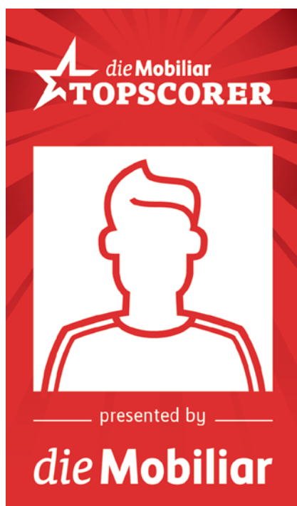
Il box Topscorer sulla landing page del sito del club