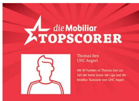
Esempio di un'inserzione con foto integrata e statistiche

Al posto delle inserzioni (vedere sopra), nel programma delle partite è possibile raffigurare anche l'inserzione con un'immagine dell'attuale Topscorer della squadra di casa con i punti finora totalizzati. I dati aperti (da aggiornare a cura del club) sono forniti dalla Mobiliare.