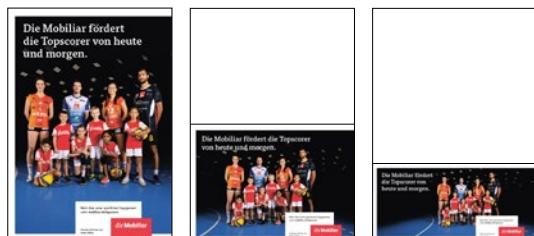
Annonces pour le format A4

Les annonces pour les programmes de match aux formats A4, A5 ou A6/5 existent dans les tailles ½ page, ½ page et ⅓ page. Veuillez toujours utiliser la plus grande version possible.