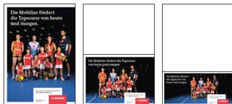
Annonces pour le format A5