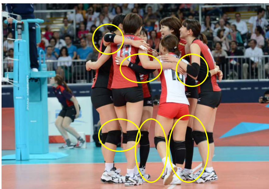
Foto 1: Polsini, protezione gomito, ginocchiera e calze al ginocchio/calzini