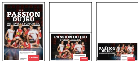
Annonces pour le format A5