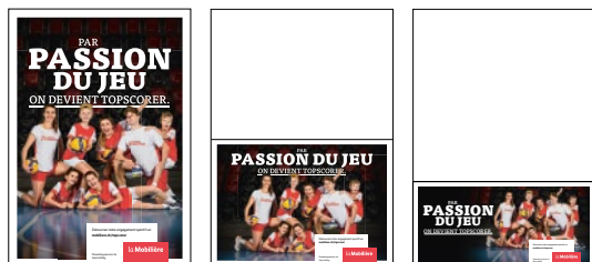
Annonces pour le format A4

Les annonces pour les programmes de match aux formats A4, A5 ou A6/5 existent dans les tailles ½ page, ½ page et ⅓ page. Veuillez toujours utiliser la plus grande version possible.